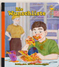
DIE WUNSCHLISTE TISCHMANIEREN - Band 4

Diese Buchreihe eignet sich besonders schön für: