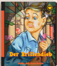
DER BRILLENDIEB STEHLEN - Band 3