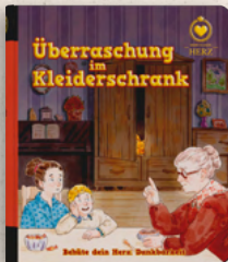
ÜBERRASCHUNG IM KLEIDERSCHRANK DANKBARKEIT - Band 2