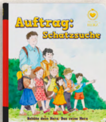
AUFTRAG: SCHATZSUCHE DAS REINE HERZ - Band 1