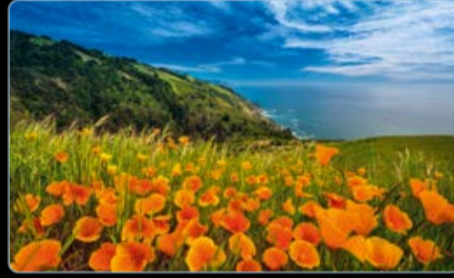
Juni Big Sur, Kalifornien, USA