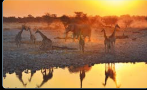
Juli Okaukuejo, Etosha Nationalpark, Namibia