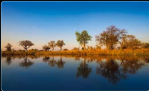
September Kwando Fluss, Mudumu Nationalpark, Namibia