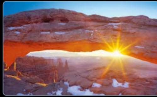
Februar Mesa Arch, Canyonlands Nationalpark, Utah, USA