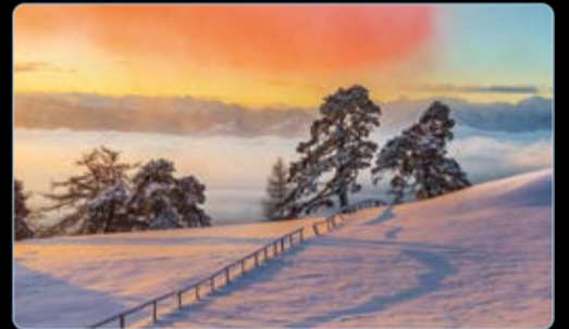
Dezember St. Anton, Appenzell, Schweiz