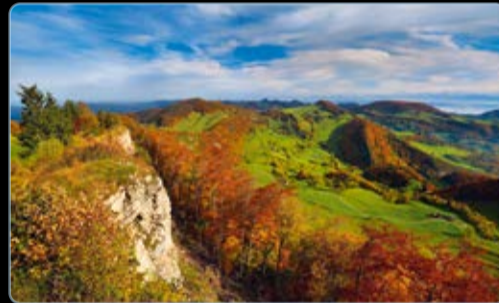
Oktober Passwang, Ramisgraben, Solothurn, Schweiz