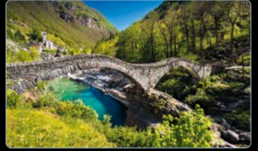
August Ponte dei Salti, Valle Verzasca, Tessin, Schweiz