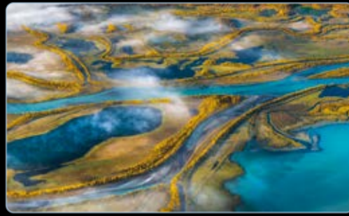
März Rapadalen, Sarek Nationalpark, Schweden