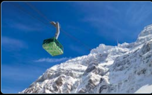
Januar Säntisbahn, Appenzell, Schweiz