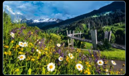
April Sunnibergbrücke, Prättigau, Graubünden, Schweiz