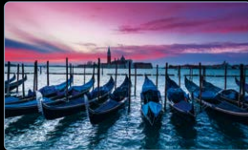
November Venedig, Italien