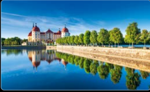
Mai Schloss Moritzburg Sachsen, Deutschland